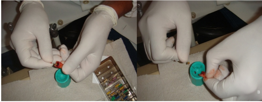
Figura 3 – Remoção (A) e deposição de raspas de dentina infectada no interior de pote Dappen (B).

Utilizando luvas cirúrgicas estéreis e dispondo de limas endodônticas, também estéreis, em estufa a 160 °C por 2 horas, foram removidas raspas de dentina infectada dos canais radiculares dos dentes extraídos, através da técnica de limagem manual e depositadas em potes Dappen (estéreis em glutaraldeído por 10 horas) (Figura 3).