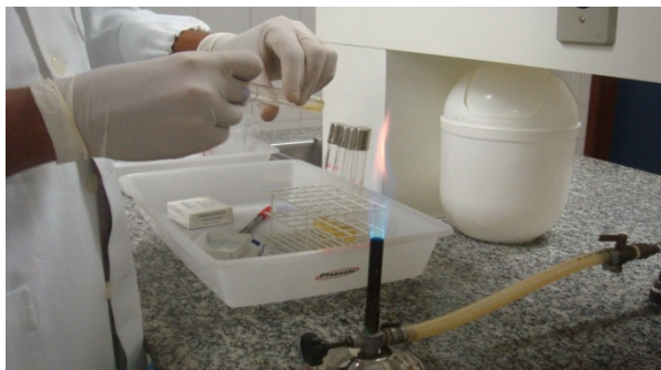
Figura 4 – Material coletado sendo transferido para o Caldo BHI para ser posteriormente incubado.

Em laboratório, o material biológico foi transferido de cada um dos swabs para quatro tubos de ensaio contendo o Caldo BHI (Figura 4), depois foram incubados, em estufa a 37 °C por 24 horas, destinados posteriormente à coloração de Gram e ao antibiograma.