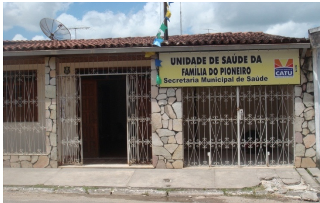
Figura 1 – Imagem externa da Unidade de Saúde da Família do bairro do Pioneiro, Catu, Bahia.

odontológico à população local, inclusive assistência aos casos de doenças emergenciais, como é o caso do abscesso periapical.