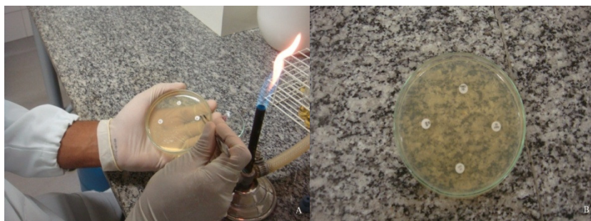
Figura 5 – Antibiograma pelo método de difusão de discos. A. Deposição dos discos na placa de Petri. B. Organização quadrangular dos discos.

Imediatamente após a semeadura, as placas receberam quatro discos de antibiograma cada uma, contendo os principais antibióticos prescritos pelos dentistas que atuam nas USF do município de Catu: amoxicilina (AMO 10), ampicilina (AMP 10), eritromicina (ERI 15) e cefalexina (CEF 30), caracterizando o antibiograma pelo método da difusão de discos. Os discos foram depositados na superfície do Ágar com auxílio de uma pinça estéril, assumindo um formato quadrangular sobre a placa, de modo que não ficassem mais próximos do que 10 a 15 mm da borda da placa de Petri e suficientemente separados uns dos outros para evitar sobreposição do halo de inibição (zona sem crescimento em volta dos discos de antibiótico) (Figura 5).