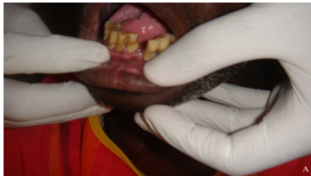
Figura 2 – Paciente diagnosticado com abscesso em região de incisivo inferior.

A coleta foi realizada pelo método de amostragem, na qual quatro usuários do serviço odontológico prestado pela Unidade de Saúde da Família local, diagnosticados clínica e/ou radiograficamente com o quadro de abscesso periapical de caráter agudo ou crônico, foram selecionados para a realização da coleta (Figura 2).