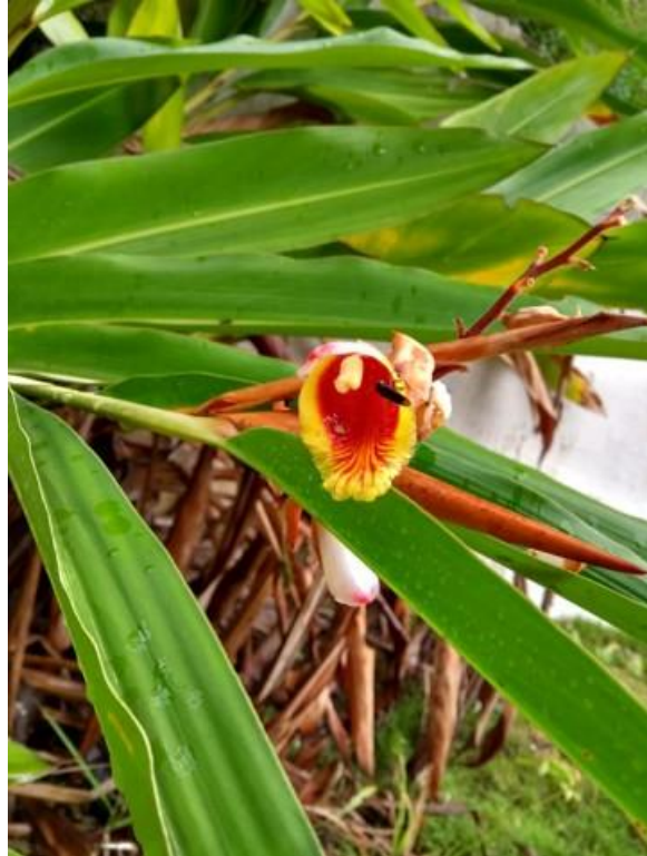
Figura 2: Flor de Alpinia nutans (L.) Roscoe sendo visitada por abelha no Museu de Ciência e Tecnologia da Bahia, Salvador, Bahia.