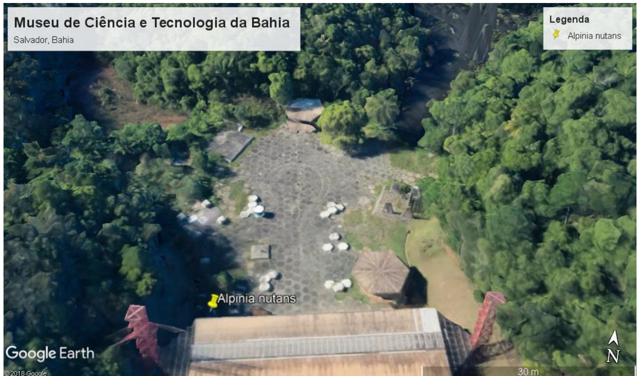
Figura 1: Área de estudo localizado nas imediações do Museu de Ciência e Tecnologia da Bahia, Salvador, Bahia.

Foram realizadas 12 coletas durante o período de setembro de 2017 a agosto de 2018, iniciando às 06:00 e finalizando às 17:00. As flores de Alpinia nutans (Figura 2) eram observadas por 10 minutos a cada 01:00, os indivíduos visitantes florais foram capturados com o auxílio de rede entomológica, sacrificados em câmara mortífera contendo acetato de etila e colocados em frascos contendo horário e planta em que foram coletados.