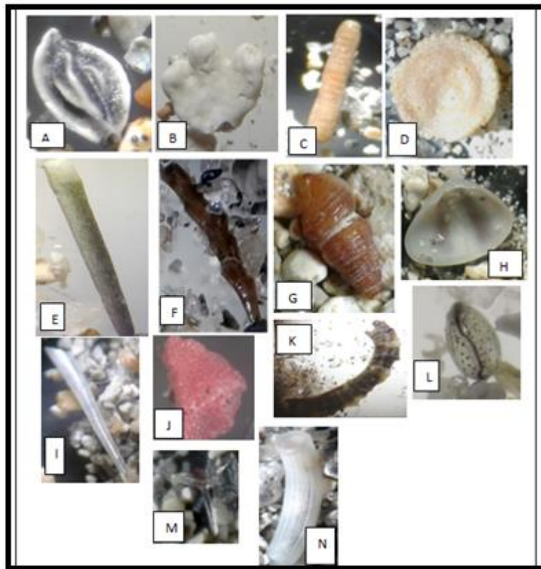
Figura 2 - Representantes das categorias biogênicas encontradas nas amostras de sedimentos da Praia da Pajuçara em novembro de 2017. A- Foraminífero bentônico; B- Fragmento de coral; C- Alga calcária Lithothamnium ; D- Alga Halimeda ; E- Espinho de equinóide; F- Briozoário; G- Concha de gastrópode; H- Concha de bivalve; I- Concha de escafópodo; J- Foraminífero Homotrema ; K- Exoesqueleto de caranguejo; L- Valva de ostracode; M- Espícula de porífero; N- Tubo de poliqueto.

caranguejos e conchas de gastrópodes (os quatro com 7%), e por fim concha de bivalve (6%) (Figura 3).