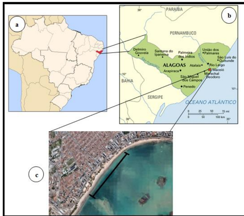
Figura 1 – Localização da praia da Pajuçara, Maceió-AL.

O presente estudo foi realizado na cidade de Maceió-Alagoas, localizada entre as coordenadas geográficas 9° 40' 00" S e 35° 44' 00" G (OMENA, 2017). As coletas foram feitas na Praia da Pajuçara (Figura 1) no mês de Novembro de 2017, no período seco e de maré alta. A área é circundada por recifes de corais e algas, apresentando 2,8km de extensão e fica entre o Porto de Maceió e o recife de franja da Ponta Verde (SANTOS, 2004).